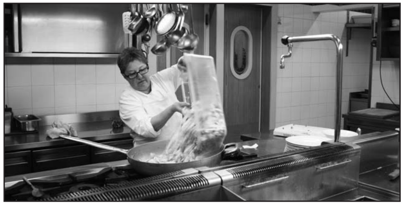
La qualità della cucina.