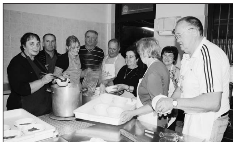
I volontari impegnati in cucina.

Come è ormai piacevole tradizione, vengono presentati i conti della festa, precisi e det-