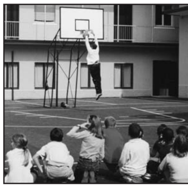
Lezione di basket alla scuola Tovini Kolbe.

Mons. Olmi ha impostato l'omelia sull'incontro con il prossimo e sulla donazione di sé agli altri. "Nel mondo - ha proseguito - tante cose vanno male perché troppe persone pensano solo a sé, al loro denaro. Voi ragazzi, che avete la fortuna di andare a scuola, incontrate tante persone che vi amano, che vi fanno del bene e