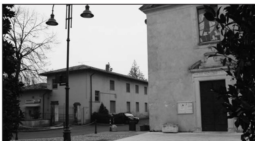
L'ex asilo di Vighizzolo a fianco della chiesa.

Lasciamo perdere le polemiche. La realtà è quella di una struttura ben funzionante, arri-