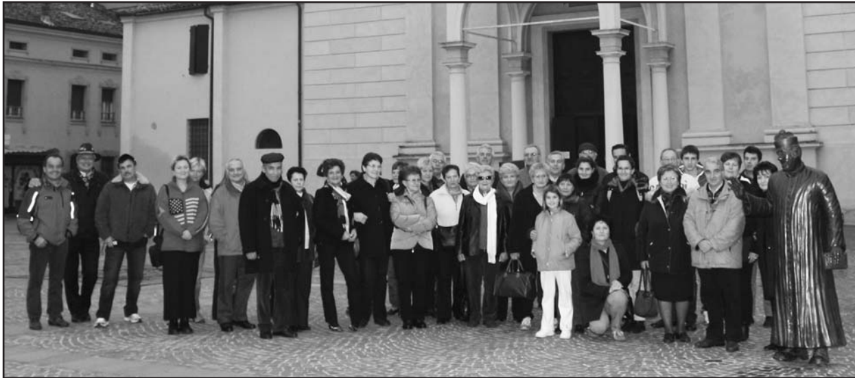
Foto ricordo in piazza con don Camillo.